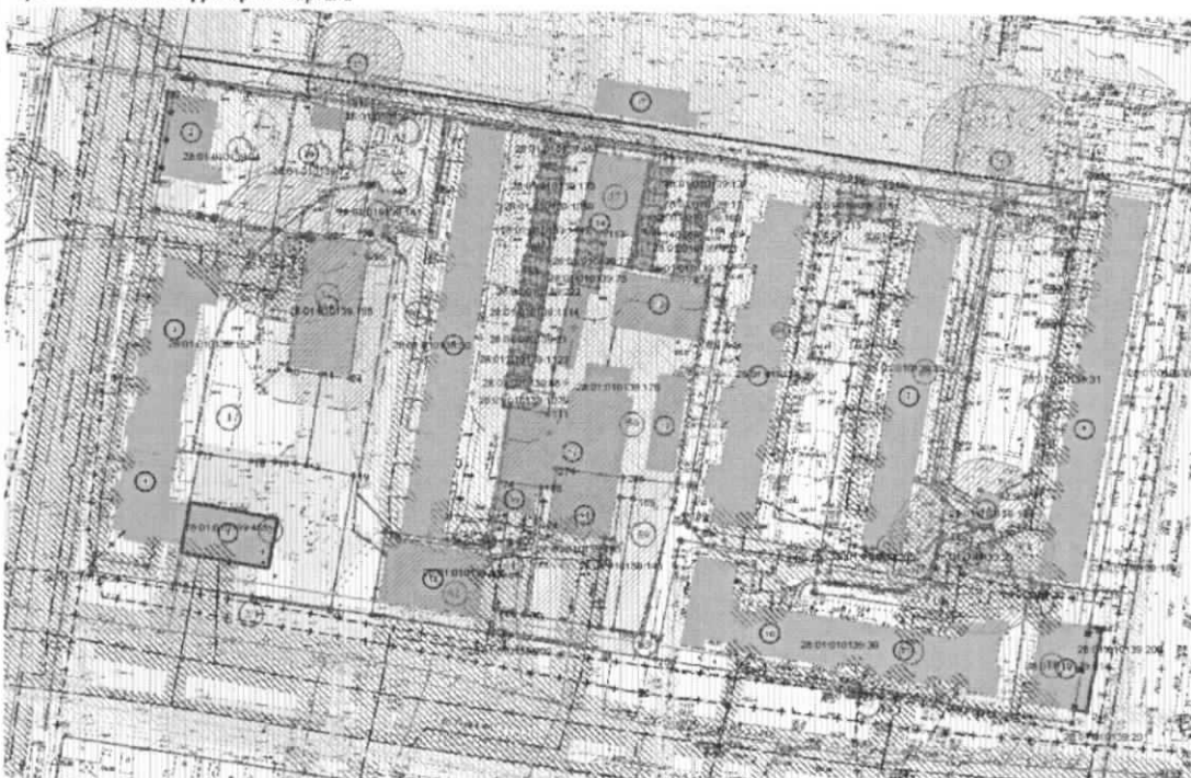
Экспликация зданий и сооружений